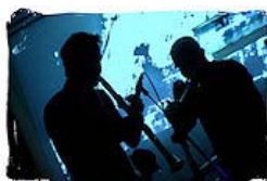
Tinissima 4tet - X (Suite for Malcolm) (Previti Pietro)