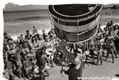
Musica sulle Bocche 2010 - Days 4 (Koritnik Ziga)