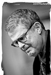
Charlie Haden Quartet West